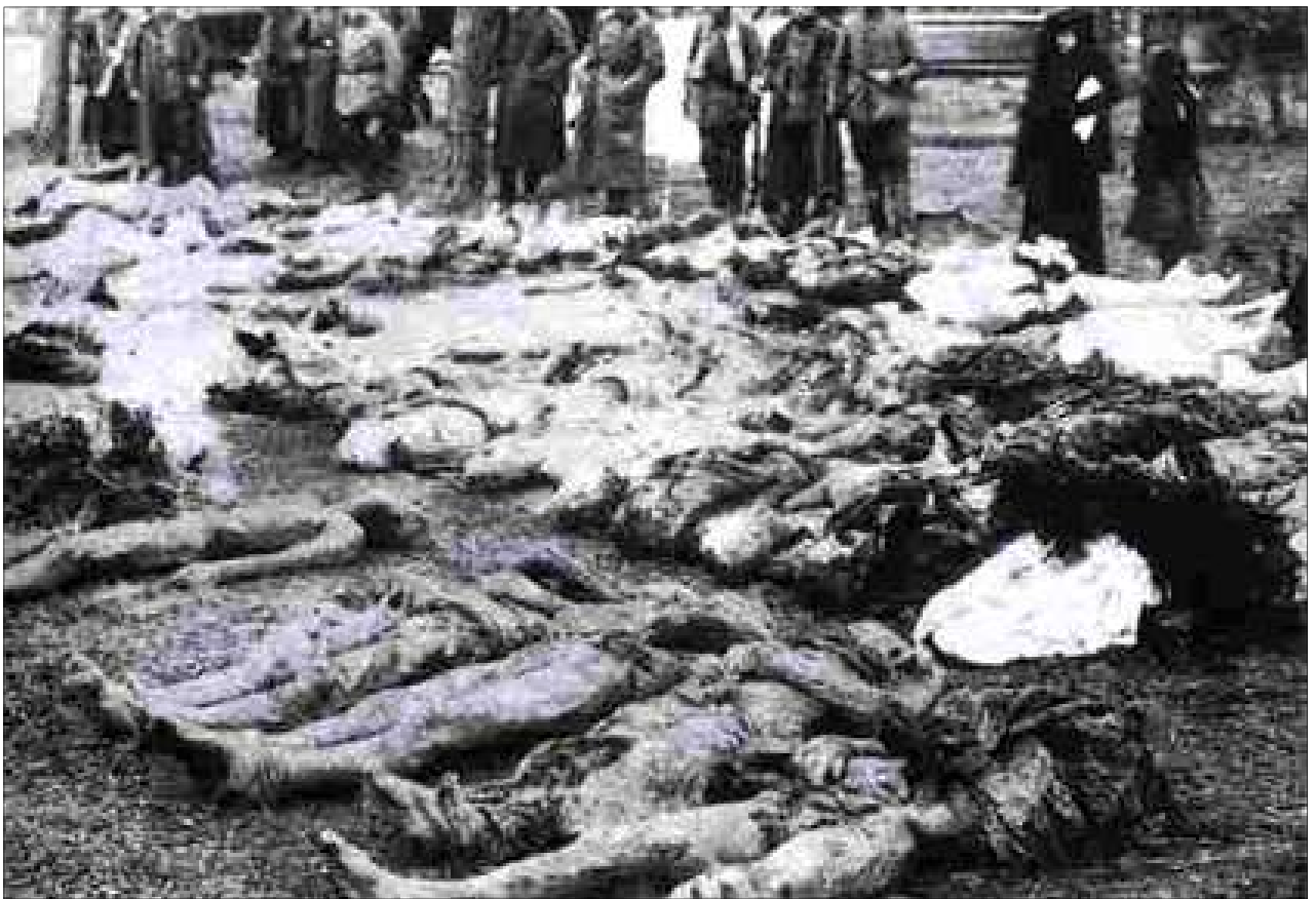
(massaslachting aangericht door de witte legers in Kiev,1919)