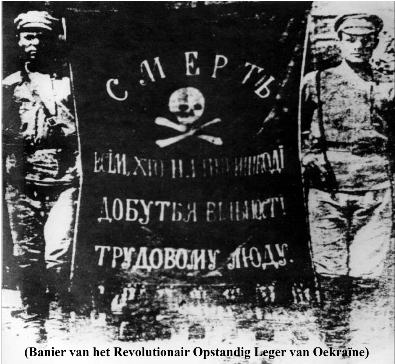
(Banier van het Revolutionair Opstandig Leger van Oekraïne)

kazernes vernield, gevangenen vrijgelaten en vrijheid van menig, associatie en pers gegarandeerd. Na een plotse tyfus epidemie, die meer dan de helft van Machno's troepen besmette, ging het rode leger onder leiding van Trotsky opnieuw in de aanval. De Cheka (communistische geheime dienst) stuurde 2 agenten om Machno te vermoorden, deze werden echter ontdekt en uitgeschakeld nadat ze hun opdracht hadden bekend.