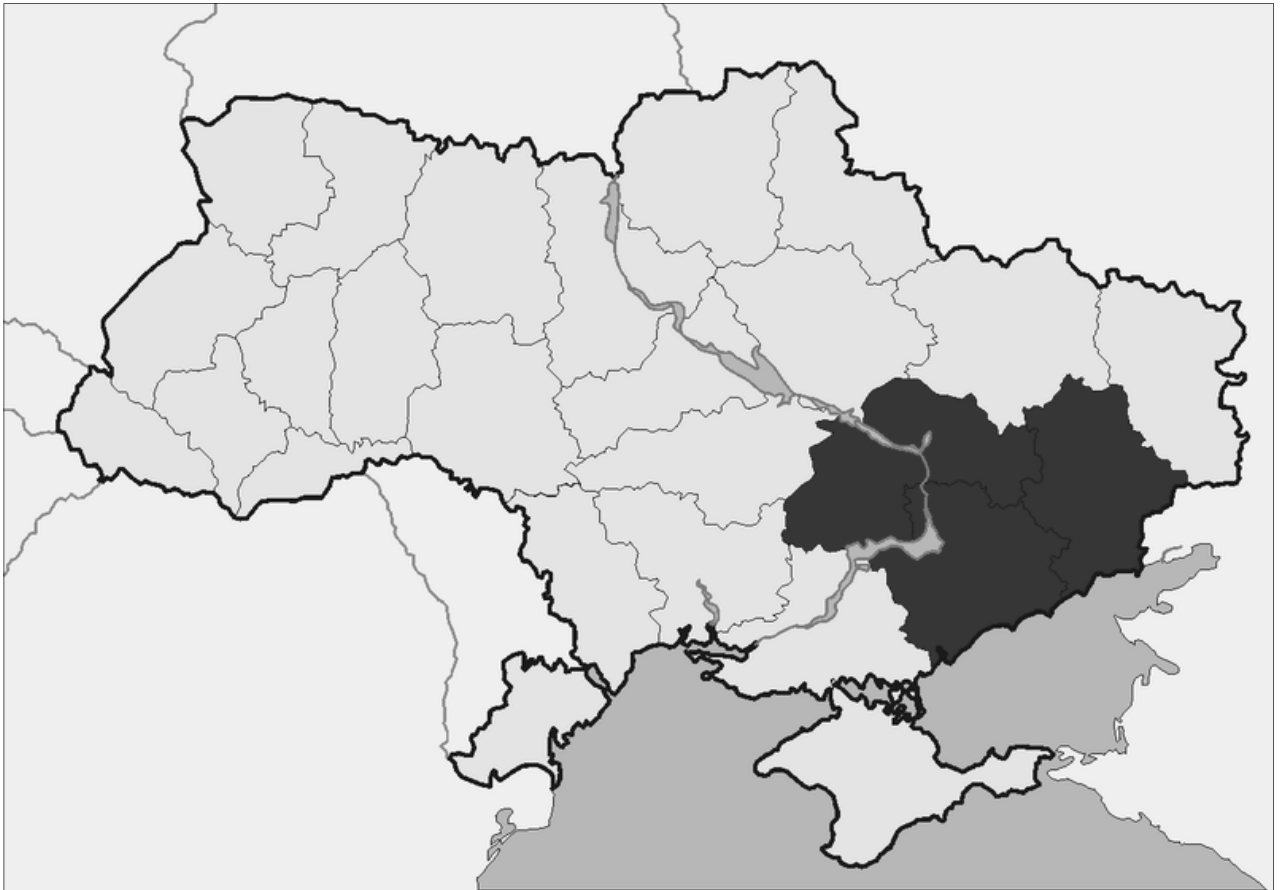
(het vrije territorium van Oekraïne)