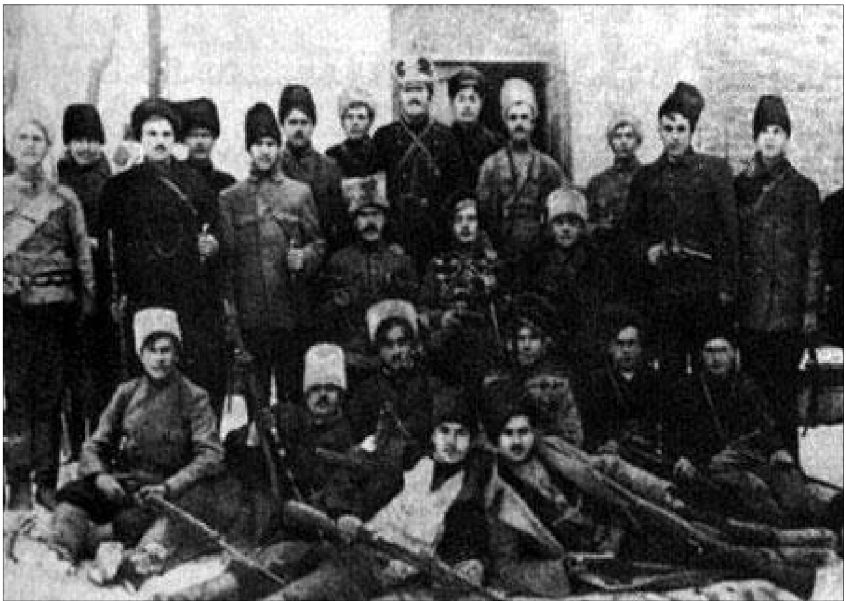
(detachment Machnovschina strijders)